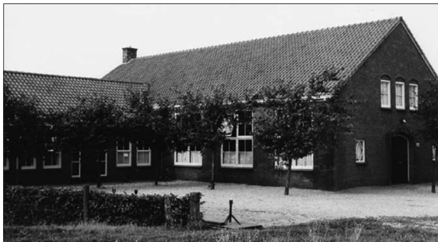
Dorpshuis in 1958.