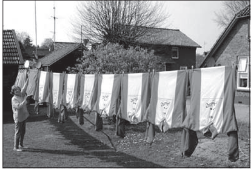
Voetbalshirts aan de lijn!

Terwijl we hartelijk afscheid nemen hoor ik nog even tussen neus en lippen door dat de vereniging een korting op de huur krijgt vanwege al de vrijwilligerswerkzaamheden. En met deze opsteker vertrek ik weer van de "Westeneng" met een warm gevoel in het hart en heel veel