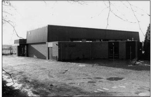
Dorpshuis "De Koepel", 1978.

ook trouw gebleven. Een deel van deze activiteiten zal straks verhuizen naar de Dr. Kruimelstaete.