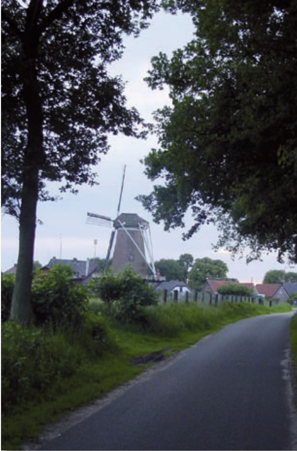
Molen vanaf Hulakkerweg.

slechts één vaste (deeltijd)kracht in de molen en verder twee vrijwilligsters. Voor geringe kosten hebben we zo een goeddraaiend kantoor. Het wordt zelfs een voorbeeld voor andere kantoren genoemd.