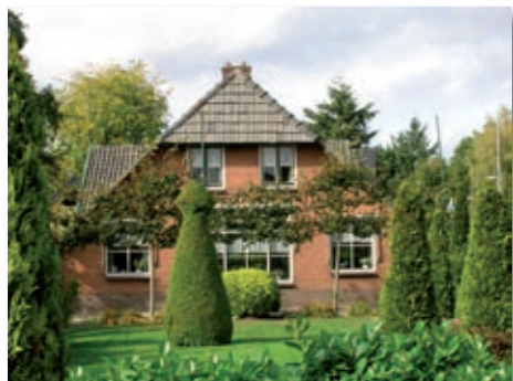
Huis van Van Ommeren.

U weet dat alle huizen hun verhalen hebben. Als men kijkt naar oude huizen kan men allerlei veranderingen in het metselwerk zien. Ook