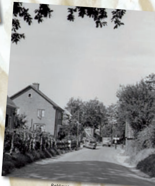
Bakkerstraat anno 1955.

De verkeersproblemen in ons dorp zijn niet op eenvoudige wijze op te lossen, daarom hebben verschillende wegen eenrichtingsverkeer. De bussen van de VAD hebben indertijd vergunning gekregen om hiervan af te wijken. Deze vergunning is thans ingetrokken en nu moeten de bussen de kronkelende Mzenhofstraat passeren. We kunnen deze verandering niet bewonderen. Temeer daar het drukke militaire verkeer zich weinig aan verkeersbordens stoort. Nu het aantal kazernes op de Veluwe weer vermeerdert is de enige oplossing verbreding van de Bakkerstraat en het opruimen van enkele verkeersobstakels.