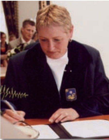
Everdien aan het werk als BABS.

en dat ze JA zeggen omdat ik dat aan ze vraag!