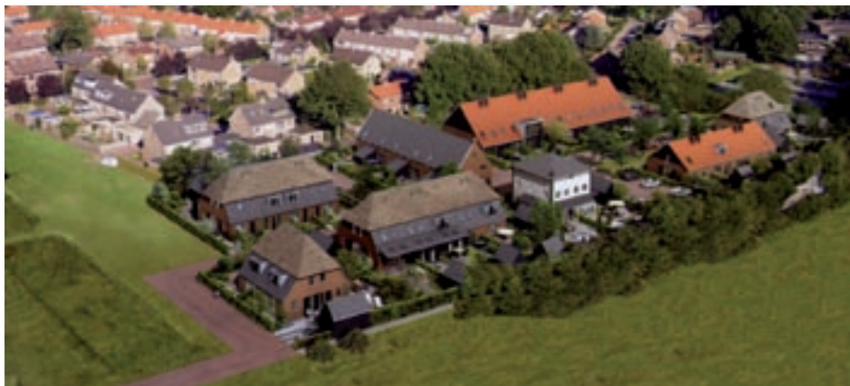
Nieuwbouw in De Hoge Eng.

Daarmee komt er midden in ons dorp een grote ruimte vrij. Over de invulling willen we straks met u gaan praten. Eerst willen we met een beperkte groep een aantal suggesties ontwikkelen. In de tweede helft van 2012 willen we deze op tafel leggen. We zullen daar-