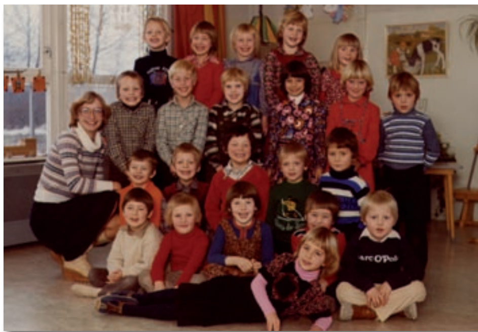
Haar eerste "echte" kleuterklas op Hummeloord in Harderwijk.

Ja, mijn eerste sollicitatie bracht me naar Strijen, een plaats in de Hoeksche Waard in de provincie Zuid Holland. Ik moest het laatste stukje met een veerpont afleggen en ik vond het eigenlijk niet erg dat ik daar niet werd aangenomen. Ik heb ook nog proeflessen gegeven in Diever en in Heteren. Tegenwoordig ligt dat in de gemeente Overbetuwe, dus ook niet direct naast de deur. In Harderwijk werd ik aangenomen op de kleuterschool Hummeloord en daar heb ik gewerkt in de periode 1976 – 1980. Ik ben gestopt na de geboorte van ons eerste kind, omdat er toen geen deeltijdwerken bestond en omdat ik het wel fijn vond thuis, bij de kleine. Na twee jaar werd onze tweede dochter geboren.