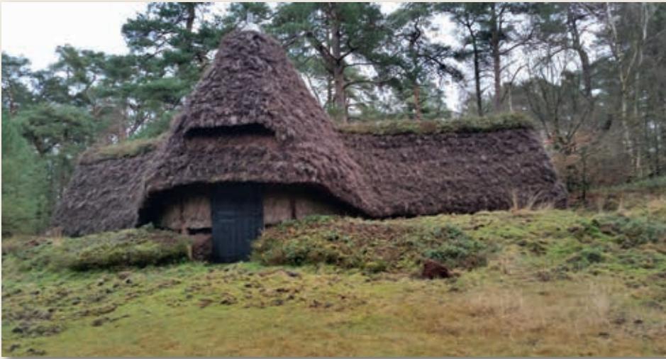
Gerestaureerde voederhut aan de buitenkant.

kwamen uitleven op en bij de hei. Aalt zag ze gaan en sloot meteen met zijn trekker het pad af waarlangs ze weer moesten vertrekken. Met een grote mond probeerden ze hem te bewegen hen door te laten, maar tevergeefs, Aalt hield voet bij stuk. Aalt bekijkend dachten ze er ook maar niet aan hem met geweld aan de kant te schuiven. Ondertussen had hij een boswachter met opsporingsbevoegdheid gebeld, die vlak daarna verscheen en de heren de verdiende boete gaf.