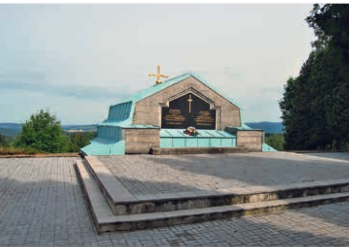
Het mausoleum in Jindřichovice (bij Karlsbad), 28 juni 2014, John Stienen

Op de dag van aankomst van het transport besluit Tsjecho-Slowakije tot een gedeeltelijke mobilisatie vanwege de opgelopen spanningen met Hitler-Duitsland om het Sudetenland, waar het mausoleum middenin ligt. Vier maanden later volgt de annexatie van het gebied. De voorbode van de nieuwe oorlog heeft de overblijfselen van de in Nederland overleden Servische soldaten ingehaald.