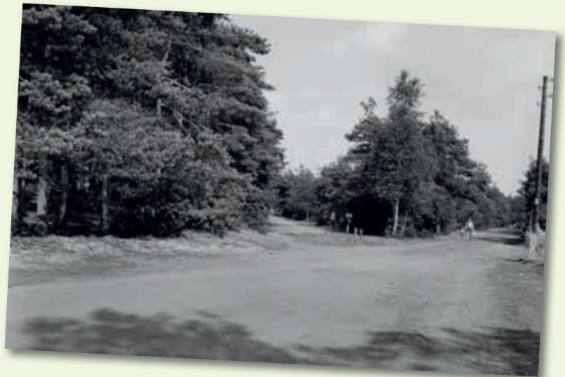
Splitsing Doodeweg Laak 1960.