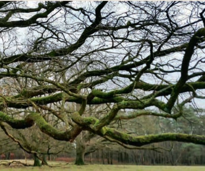
Eeuwenoude eiken op het Kroondomein.

Aalt vertelt me dan het verhaal van een aantal lieden met crossmotoren die hun “hobby”