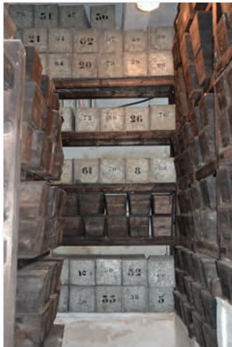
De uit Nederland in zinken kisten overgebrachte stoffelijke resten in de crypte van het mausoleum in Jindřichovice (bij Karlsbad), 28 juni 2014, Fabian Vendrig

Op maandag 16 mei wordt op Begraafplaats 'Nieuw-Buinen 32' de laatste in Nederland begraven Servische soldaat die via Nijmegen zal worden overgebracht opgegraven. Na een korte plechtigheid op Rustoord, de begraafplaats van de diaconie van de Nederlands-hervormde gemeente in Nijmegen, in de ochtend van woensdag 18 mei, worden de stoffelijke resten van 88 soldaten in drie lijk-auto's geplaatst. De rouwstoet begeeft zich